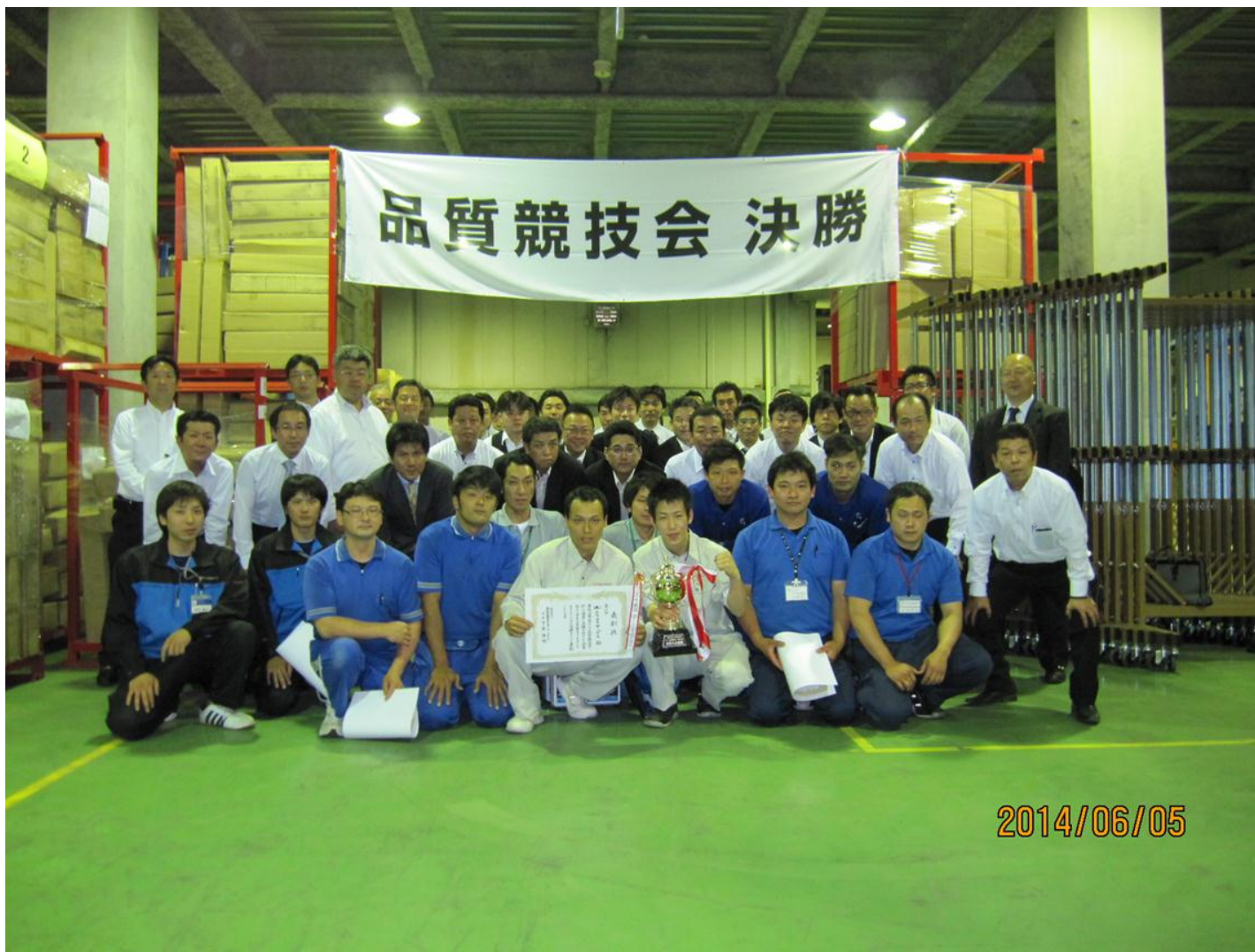
(株)エスエスサービス様 優勝おめでとうございます。