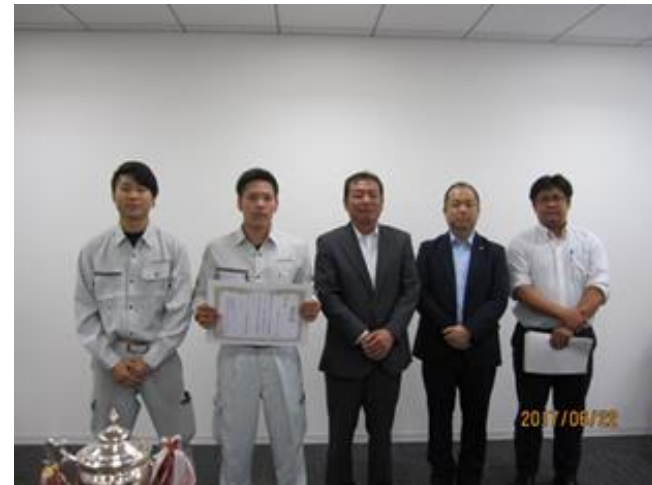
第3位 (株)エスエスサービス