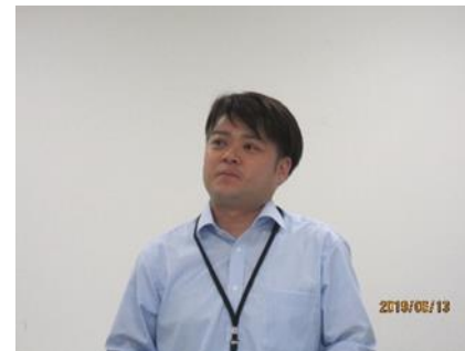
ユナイトサービス(株) 大橋所長様