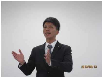
エースカーゴ(株) 足立本部長様