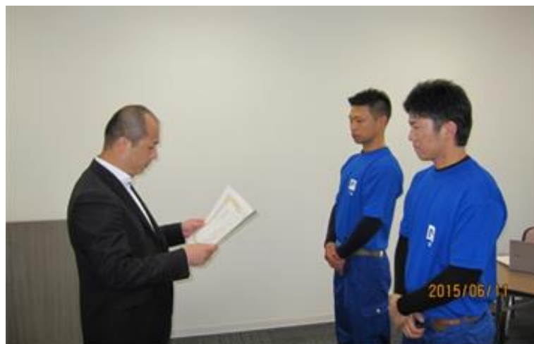
第2位 ユナイトサービス(株)